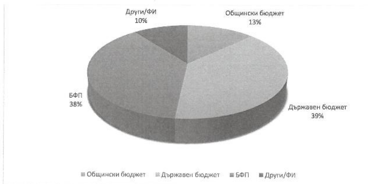
Фигура 15. Ефективност на изпълнение по източници на финансиране

Най-голям дял от инвестираните средства са финансирани от държавния бюджет - 38,65% или 47 943 221 лева за проекти на общинската администрация, следвани от финансиране от структурните и кохезионни фондове на ЕС – 37,80 % или 46 890 384 лева за проекти на общинската администрация, както и за съфинансиране на проекти на частния бизнес, които са реализирани през периода на междинната оценка. През периода от общинския бюджет за изпълнение на ПИРО са реализирани 16 015 132 лева, което представлява 12,91%. Другите източници на финансиране формират 10,42% или 12 931 898 лева от изразходвания ресурс и това са основно частните инвестиции за съфинансиране на проекти от различни европейски фондове.