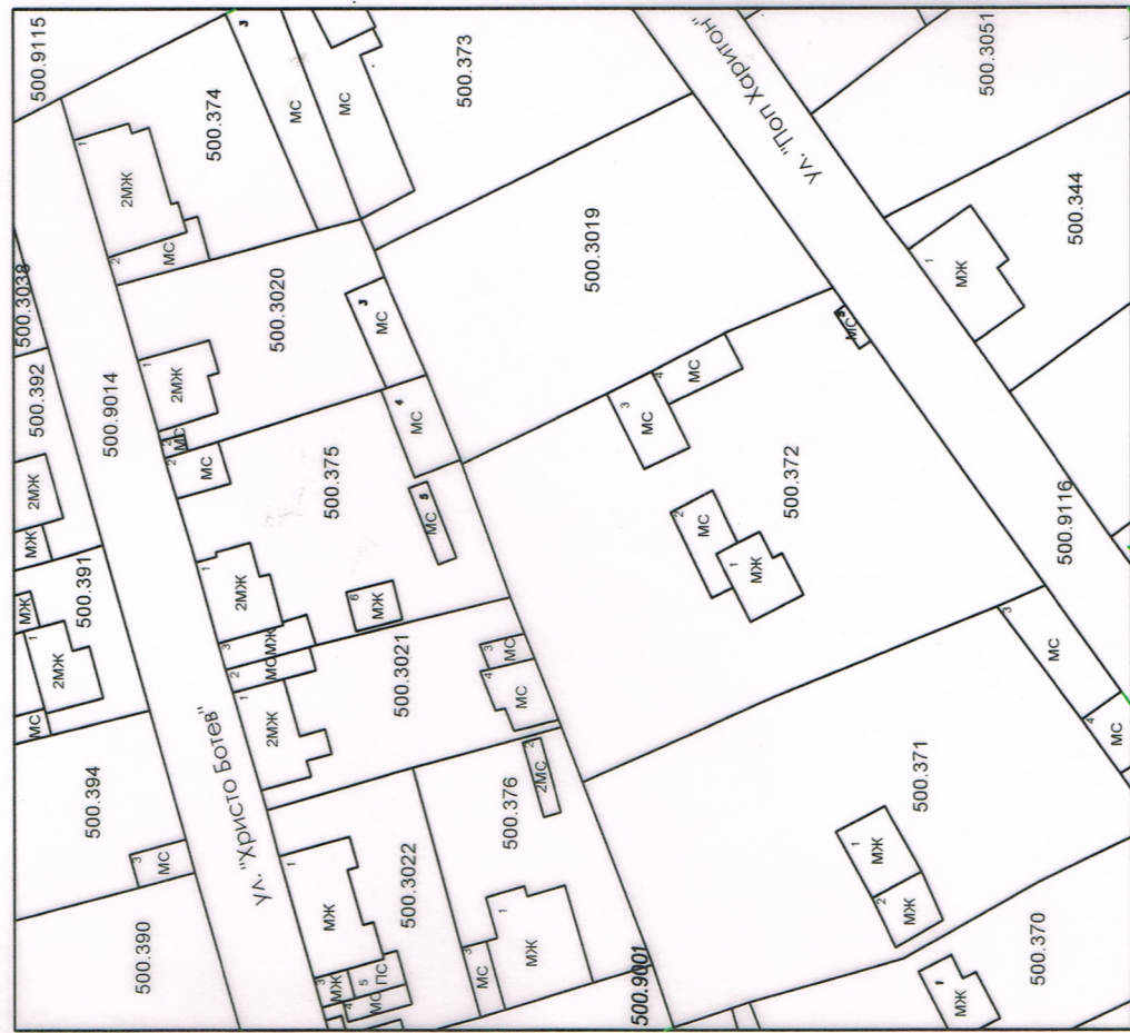
Действаща Кадастрална карта за имотите М 1 : 1 000