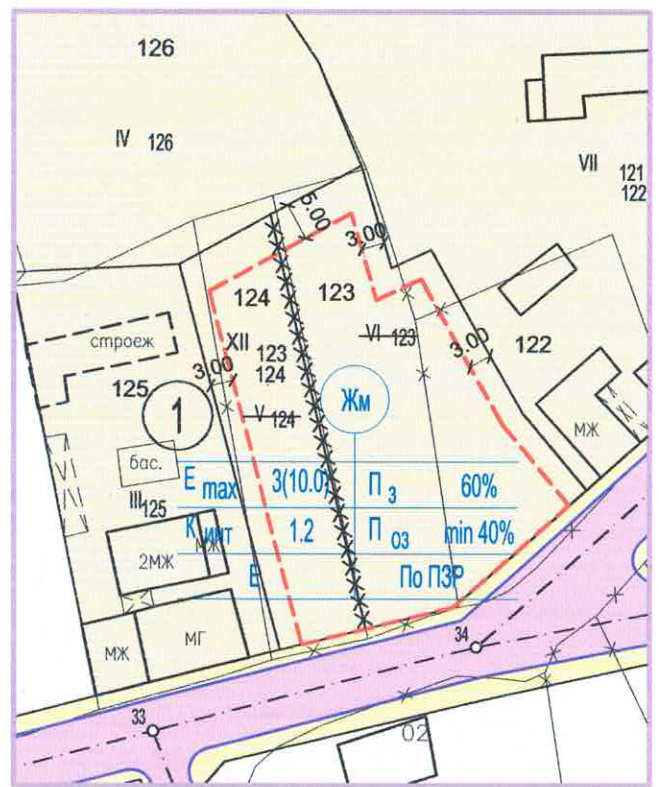
ЧИ ПУП - ПЗ