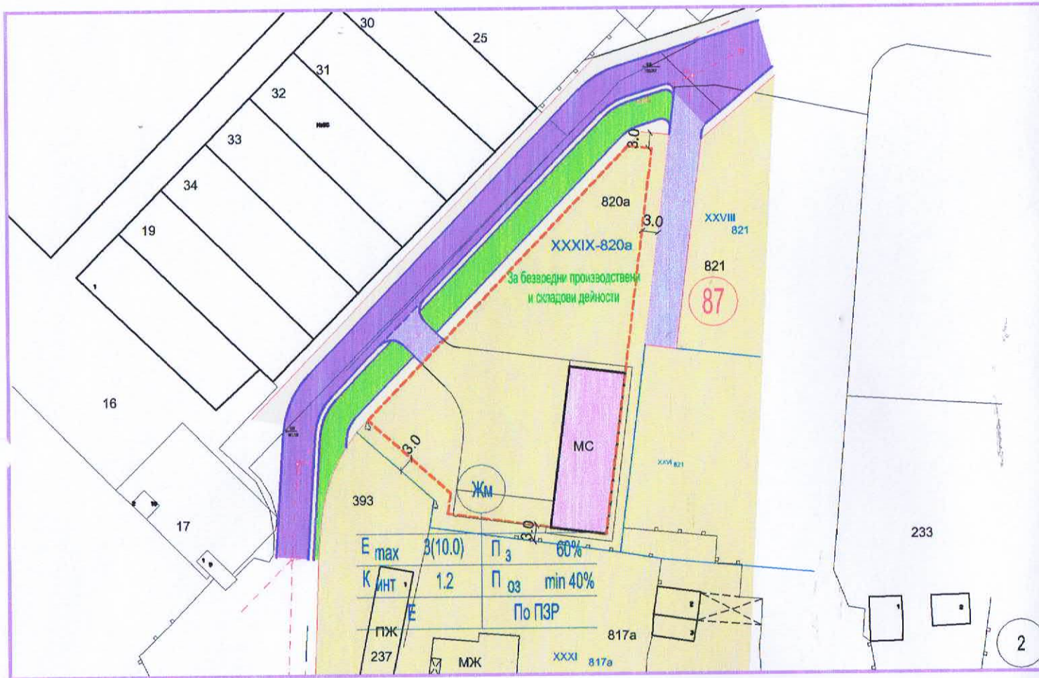
ИПУП - ПЗ