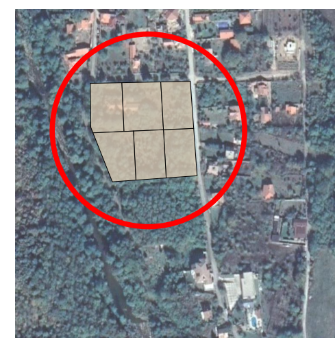
СХЕМА НА МЕСТОПОЛОЖЕНИЕТО НА ИМОТИТЕ М 1:5000

ЖМ Жилищна устройствена зона с ниска височина височина 2/3(10) 60% - плътност на застрояване К интензивност - 1,2 40% - минимална плътност на озеленяване свободен начин на застрояване - e