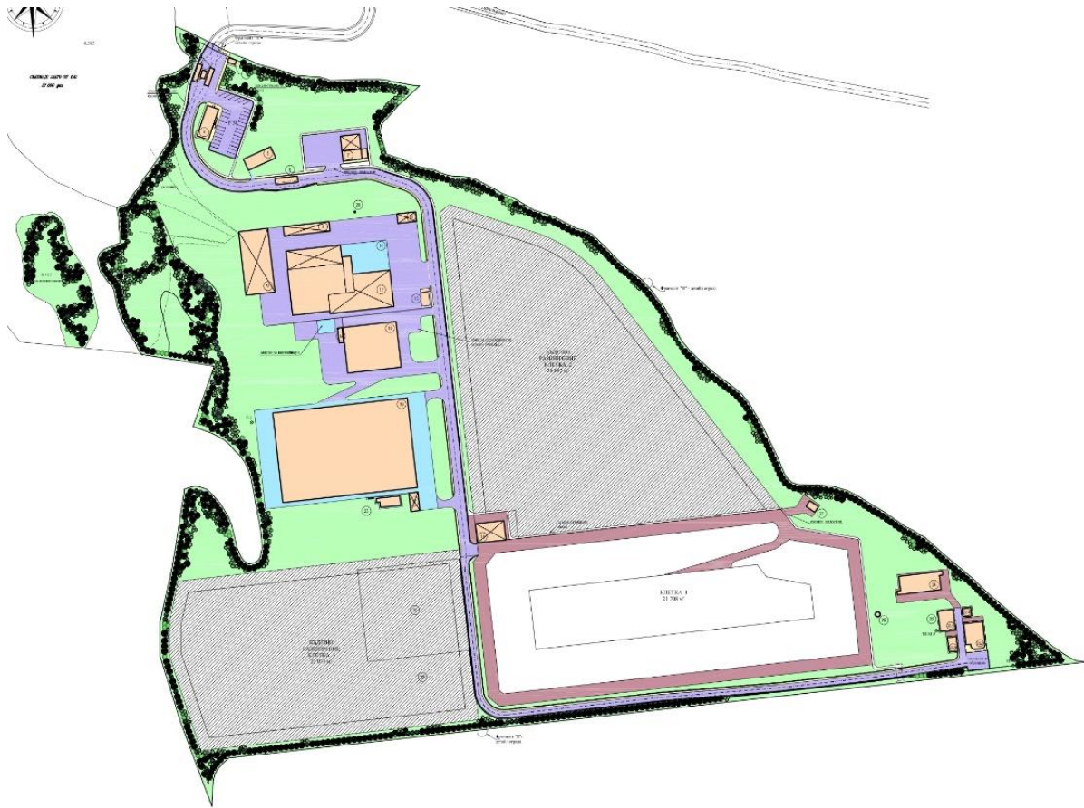
Фигура 2 Генерален план на площадката на РДНО Велико Търново