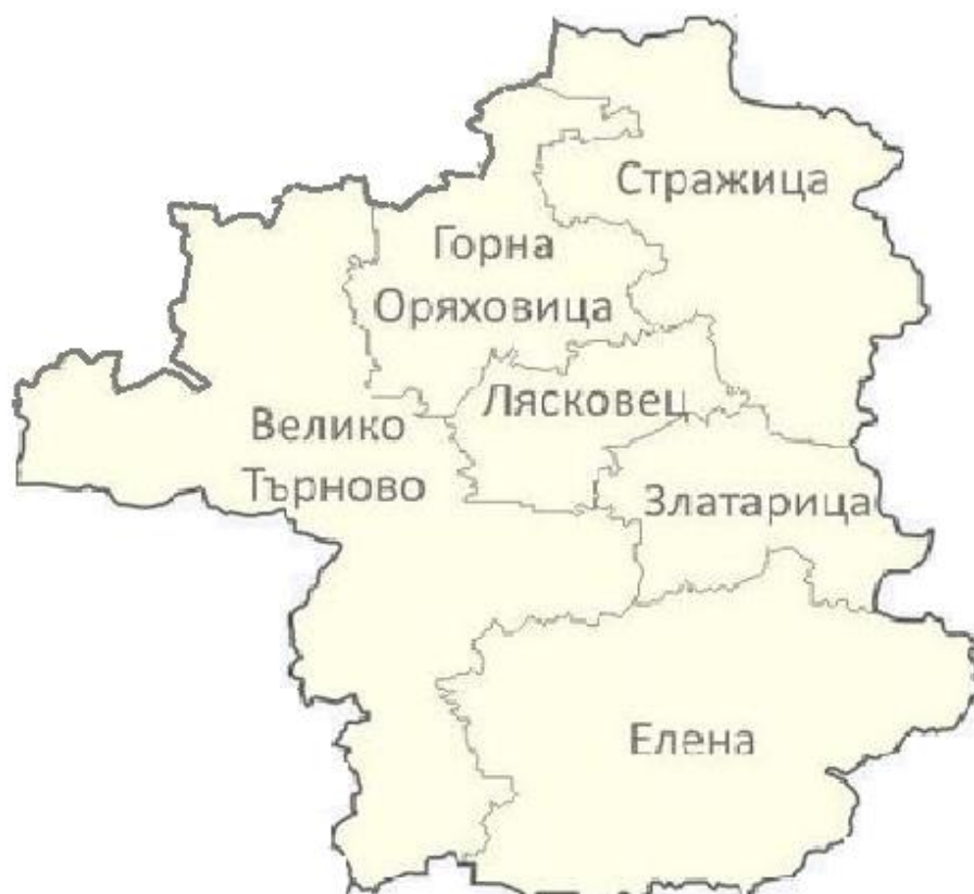
Таблица 1 Площ на общините от Регионалната система за управление на отпадъците регион Велико Търново