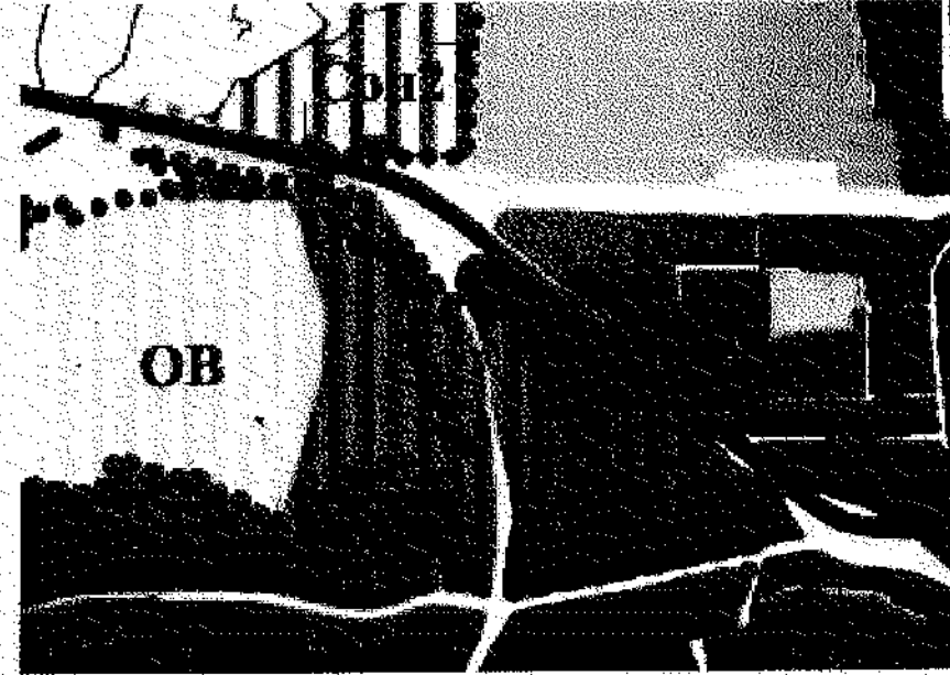
извадка от ОУП на Община Велико Търново