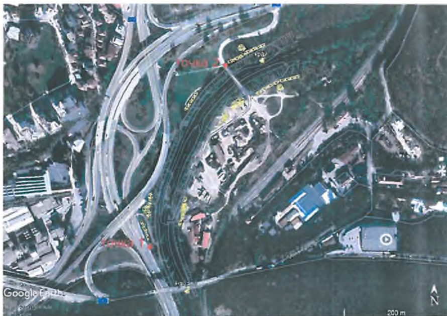
Фиг.1 Изходни точки

След натоварване на самосвалите на десния бряг на реката, те се включват в движението в платното в изходна точка 2 (фиг.1) и продължава по транспортната схема дадена в приложение 2.