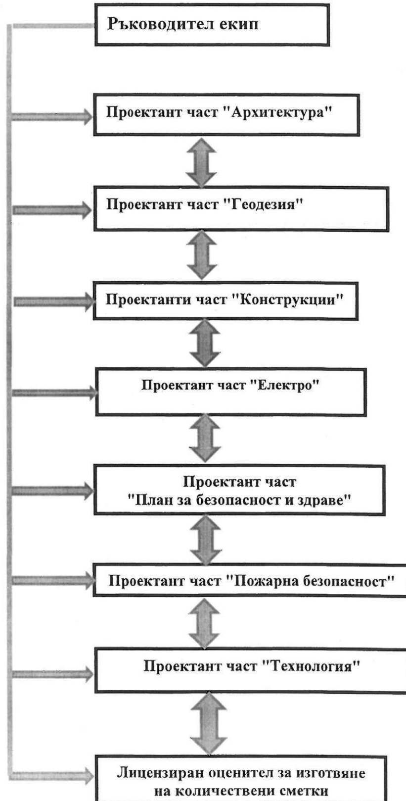
Схема на взаимодействие в проектантския екип

За успешното изпълнение на поръчката ще се създадат взаимовръзки между участниците, илюстрирани със следната схема: